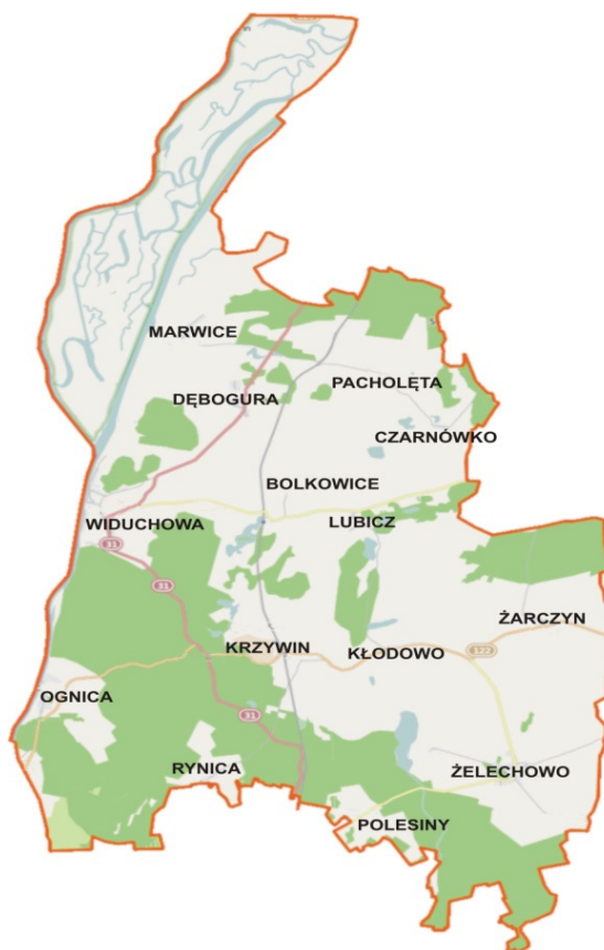
Rys. 2. Lokalizacja sołectwa Żelechowo na mapie gminy Widuchowa