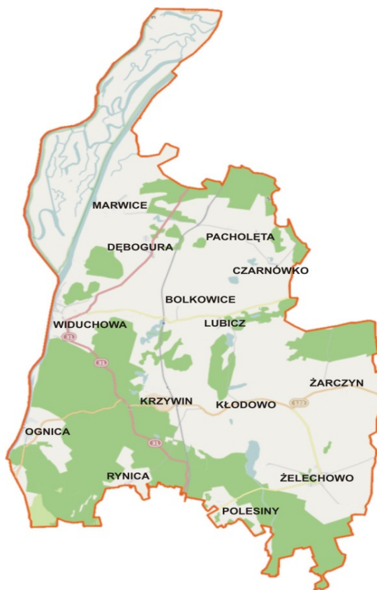
Rys. 2. Lokalizacja miejscowości Żarczyn na mapie gminy Widuchowa