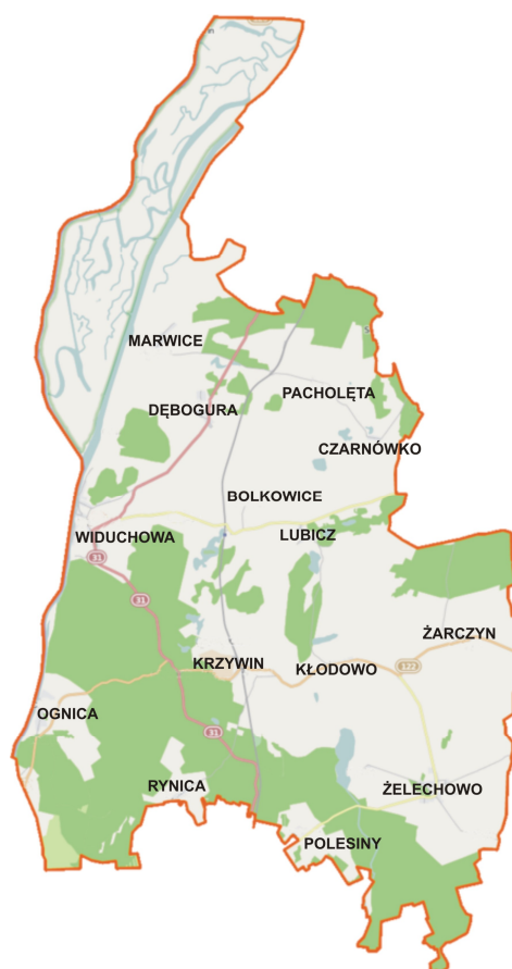
Rys. 2. Lokalizacja miejscowości Rynica na mapie gminy Widuchowa

Program Rozwoju Obszarów Wiejskich na lata 2014-2020