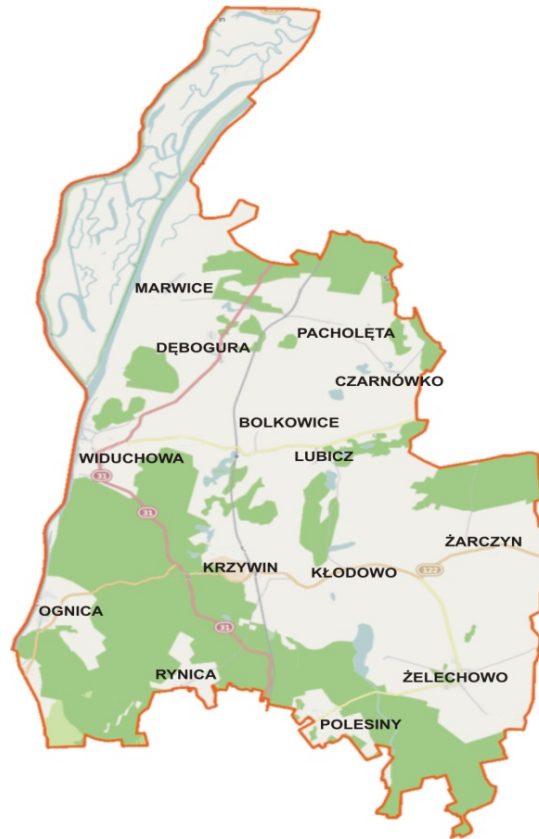
Rys. 2. Lokalizacja miejscowości Ognica na mapie gminy Widuchowa