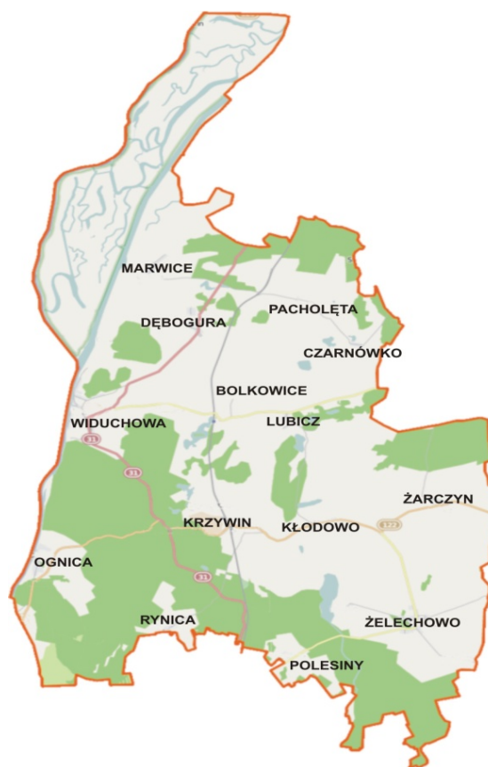
Rys. 2. Lokalizacja miejscowości Marwice na mapie gminy Widuchowa

Program Rozwoju Obszarów Wiejskich na lata 2014-2020