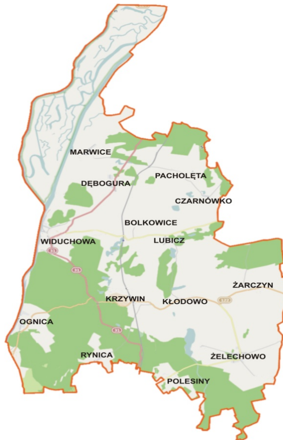
Rys. 2. Lokalizacja miejscowości Lubicz na mapie gminy Widuchowa

- Kościół św. Judy Tadeusza - nr. rejestru 130 wpisany w 1956.08.29