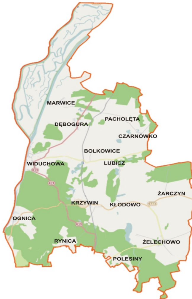
Rys. 2. Lokalizacja miejscowości Krzywina na mapie gminy Widuchowa