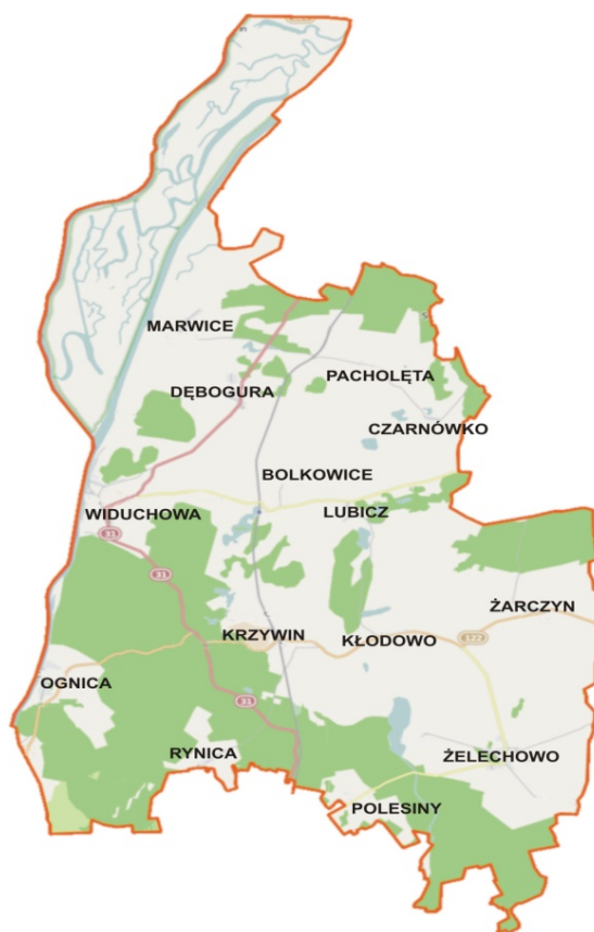
Rys. 2. Lokalizacja miejscowości Dębogóra na mapie gminy Widuchowa

Program Rozwoju Obszarów Wiejskich na lata 2014-2020