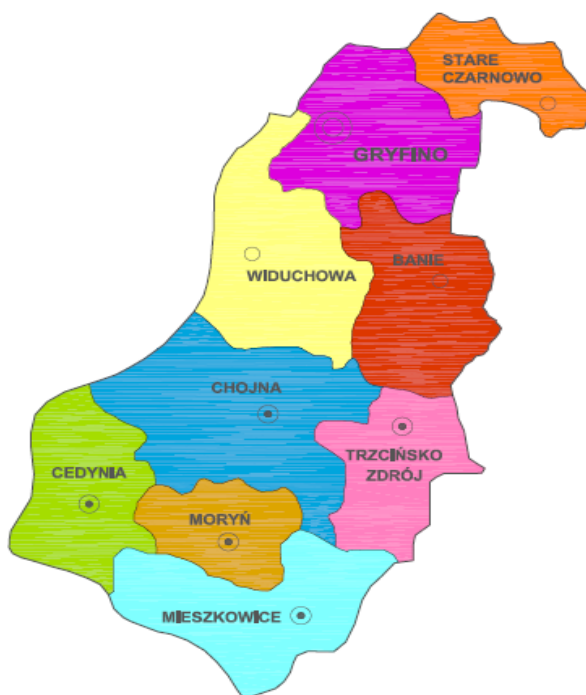
Rys. 1. Lokalizacja gminy Widuchowa na mapie powiatu gryfińskiego

Gmina Widuchowa, jest gminą wiejską i położona jest w środkowej części Województwa Zachodniopomorskiego, leży ona w Dolinie Dolnej Odry i na Pojezierzu Myśliborskim nad Odrą. Jest gminą o charakterze rolniczo –turystycznym. Od strony północnej graniczy z gminą Gryfino, od południowej z gminą Chojna a od wschodniej z gminą Banie, natomiast od strony zachodniej przez rzekę Odrę z Republiką Federalną Niemiec. Gmina obejmuje 14 sołectw. Siedzibą organów gminy jest miejscowość Widuchowa -centralnie położone na terenie gminy